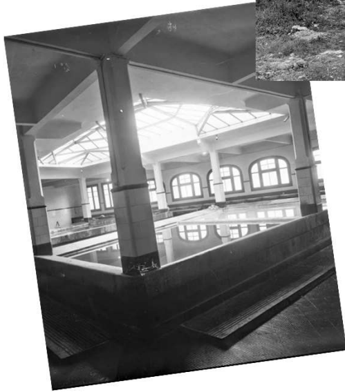
Victoria Leceako etxea